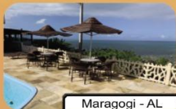
Maragogi - AL