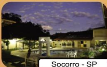
Socorro - SP