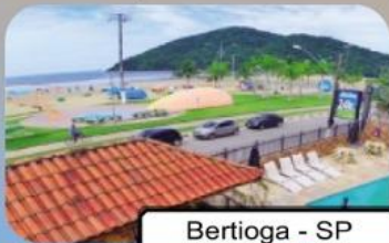
Bertioga - SP