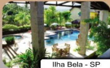
Ilha Bela - SP