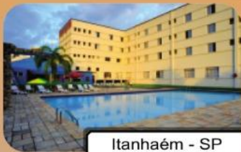
Itanhaém - SP