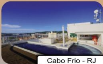
Cabo Frio - RJ