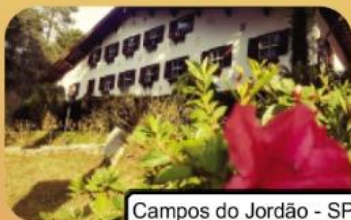
Campos do Jordão - SP