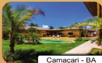
Camaçari - BA