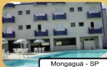
Mongaguá - SP