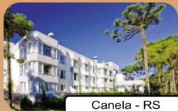
Canela - RS