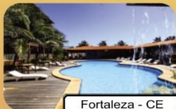
Fortaleza - CE

Rua Onze de Agosto Nº 68, 6º andar sala 63 - Bairro Sé - São Paulo Capital