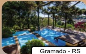
Gramado - RS