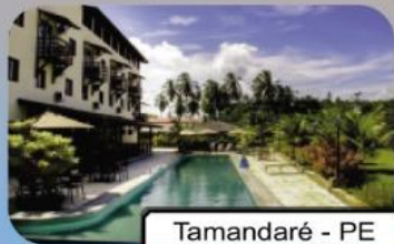
Tamandaré - PE