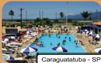
Caraguatatuba - SP