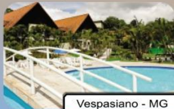
Vespasiano - MG