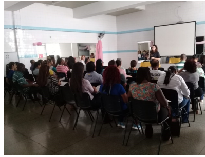
Encontro de Rede - Intersetorialidade: do acesso a direitos à inclusão social do egresso do sistema prisional

Somando a isso, é por meio das articulações realizadas com a rede parceira que se torna possível, através das parcerias realizadas, propiciar para o público o acesso a cursos e/ou oficinas voltados para discussões ou capacitações de temáticas diretamente voltadas para a retomada da vida em liberdade da pessoa egressa do sistema prisional. Nesse sentido, e a título exemplificativo, foi realizado em Belo Horizonte um Workshop para capacitação da atividade de Garçom em novembro, por meio de uma parceria realizada com o Instituto Recomeço, tendo sido iniciado também, neste mesmo mês, um curso de Design de Sobrancelhas em parceria com o Instituto Wilson Chagas.