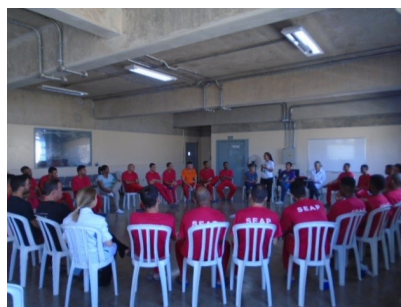
Grupo realizado com pré-egressos das Unidades Presídio Antônio Dutra Ladeira - PRADL e Complexo Penitenciário de Parceria Público-Privada - CPPP III (em Ribeirão das Neves)

Além disso, também teve um aumento no número de atividades realizadas nas unidades prisionais com o público pré-egresso. O Programa tem incentivado a realização deste tipo de ação por parte dos Analistas Sociais, considerando a importância de formação de um vínculo com as pessoas que estão prestes a deixar a unidade prisional.