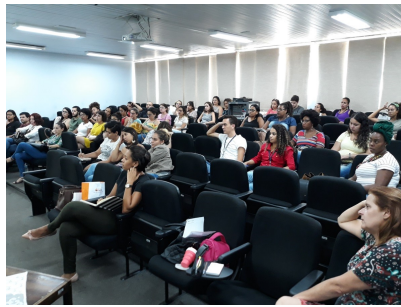
Capacitação sobre a Temática de Drogas