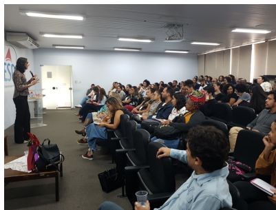
Capacitação: Direitos Básicos Sobre a População LGBT

Realizada capacitação com a presença de toda a equipe técnica do PrEsp dos municípios de Belo Horizonte, Betim, Contagem, Ribeirão das Neves e Santa Luzia, bem como de representantes da equipe técnica dos Programas CEAPA, Fica Vivo! e Mediação de Conflitos. Também estiveram presentes na capacitação a Diretora, Gerentes e os Supervisores Metodológicos do Programa. Para o momento foi convidada a Professora Duda Salabert para debater com a equipe sobre a temática do acompanhamento de casos de pessoas LGBTQI+ que acessam o Programa, bem como as possibilidades de inserção desse público na rede de apoio para acesso a direitos. A capacitação propiciou momentos de debate e de reflexão, com ampla participação do público presente.