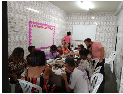
Dinâmica de Grupo – Familiares de Egressos

Por fim, importante também destacar que ações vêm sendo desenvolvidas de modo a aproximar o PrEsp dos familiares de pessoas egressas e pré-egressas do sistema prisional. Assim, o Programa tem incentivado a realização de grupos com este público específico buscando a vinculação do mesmo para que a família se torne um fator efetivo de proteção para o egresso do sistema prisional quando este alcançar a liberdade.