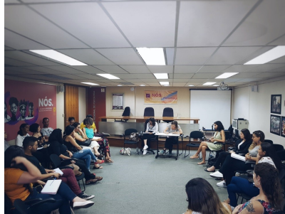
Capacitação: Pensando e Refletindo sobre Atividades Coletivas