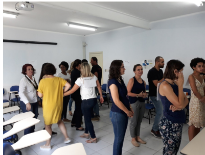
Capacitação sobre a Temática de Drogas