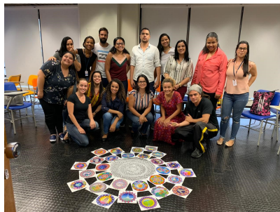
Capacitação sobre Justiça Restaurativa