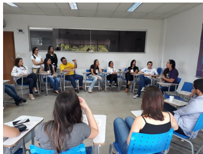
Dia da Responsabilidade Social – Temática abordada: Fortalecendo com a Rede

As atividades referentes à mobilização de rede nos municípios de atuação do PrEsp têm sido realizadas com maior amplitude pela Equipe Técnica e pelos Gestores Sociais para que fluxos de referência e contra referência possam ser criados ou reforçados, bem como para acesso a novos parceiros da rede de apoio de modo a aumentar o número de pessoas que acessam o PrEsp pela primeira vez.