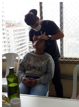
II Fórum Construindo a Liberdade: (In) visibilidade da pessoa egressa; Qualificação profissional/geração de emprego e renda; Família e Construção da Liberdade.

Outras ações realizadas pela rede parceira também tiveram a participação de representantes do PrEsp, seja para apresentação do trabalho executado, seja para discussão da temática voltada para a inclusão do público egresso do sistema prisional.