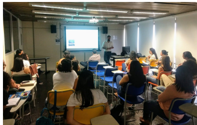
Capacitação sobre Justiça Restaurativa