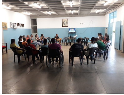
Grupo realizado na APAC de Santa Luzia com o público pré-egresso – Projeto Papo Cabeça / Masculinidade

Por fim, importante também destacar que ações vêm sendo desenvolvidas de modo a aproximar o PrEsp dos familiares de pessoas egressas e pré-egressas do sistema prisional. Assim, o Programa tem incentivado a realização de grupos com este público específico buscando a vinculação do mesmo para que a família se torne um fator efetivo de proteção para o egresso do sistema prisional quando este alcançar a liberdade.