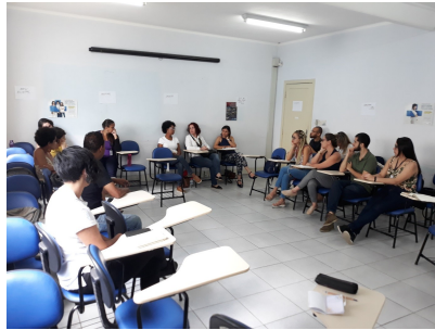
Capacitação sobre a Temática de Drogas