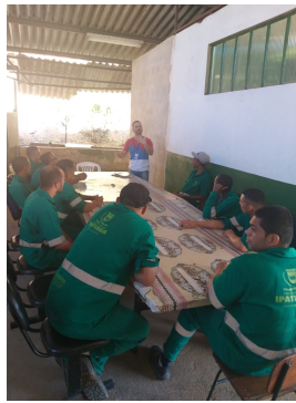
Grupo realizado com pré-egressos da Penitenciária Dênio Moreira de Carvalho, em Ipaba/MG, para divulgação do PrEsp

A realização destes grupos tem impactado sobremaneira os números relativos neste indicador, já que sua execução tem sido contínua pela equipe técnica.