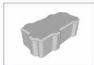
UNI-BRICK JUNTA ALARGADA