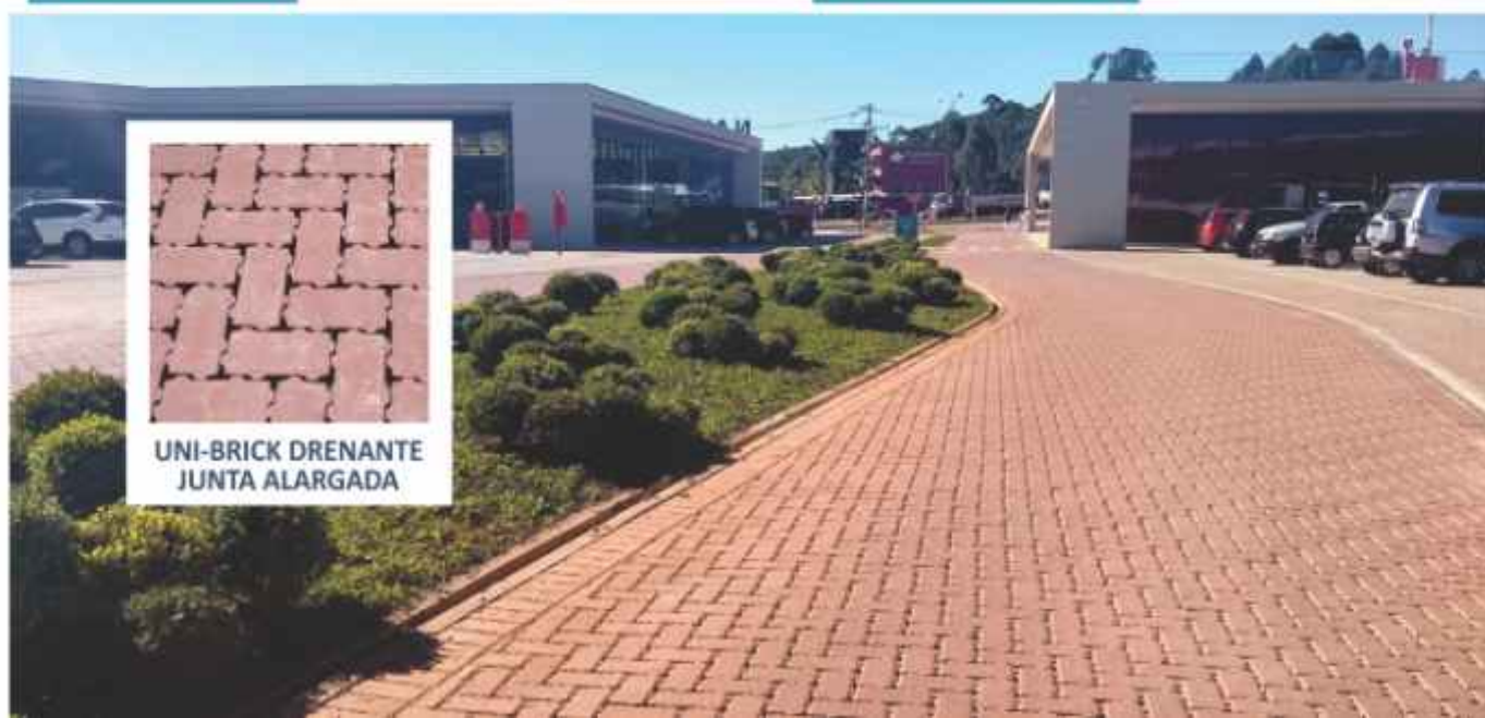
UNI-BRICK DRENANTE JUNTA ALARGADA