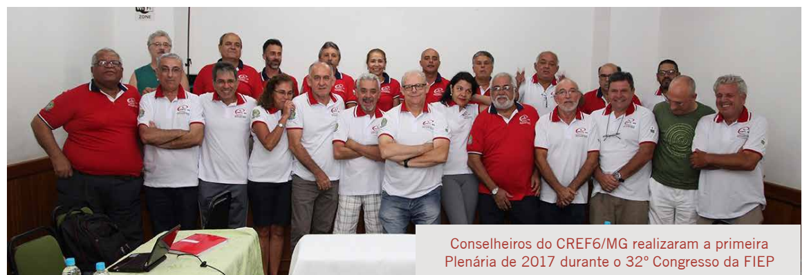
Conselheiros do CREF6/MG realizaram a primeira Plenária de 2017 durante o 32º Congresso da FIEP

O projeto desenvolvido pelo CREF6/MG em parceria com o Núcleo de Educação em Saúde Coletiva da Universidade Federal de Minas Gerais – NESCON/UFMG foi outro caso de sucesso apresentado no Congresso. Há cerca de dois anos, os dois órgãos oferecem os Cursos de Aperfeiçoamento em Saúde da Família e de Especialização Estratégia Saúde da Família para Profissionais de Educação Física.