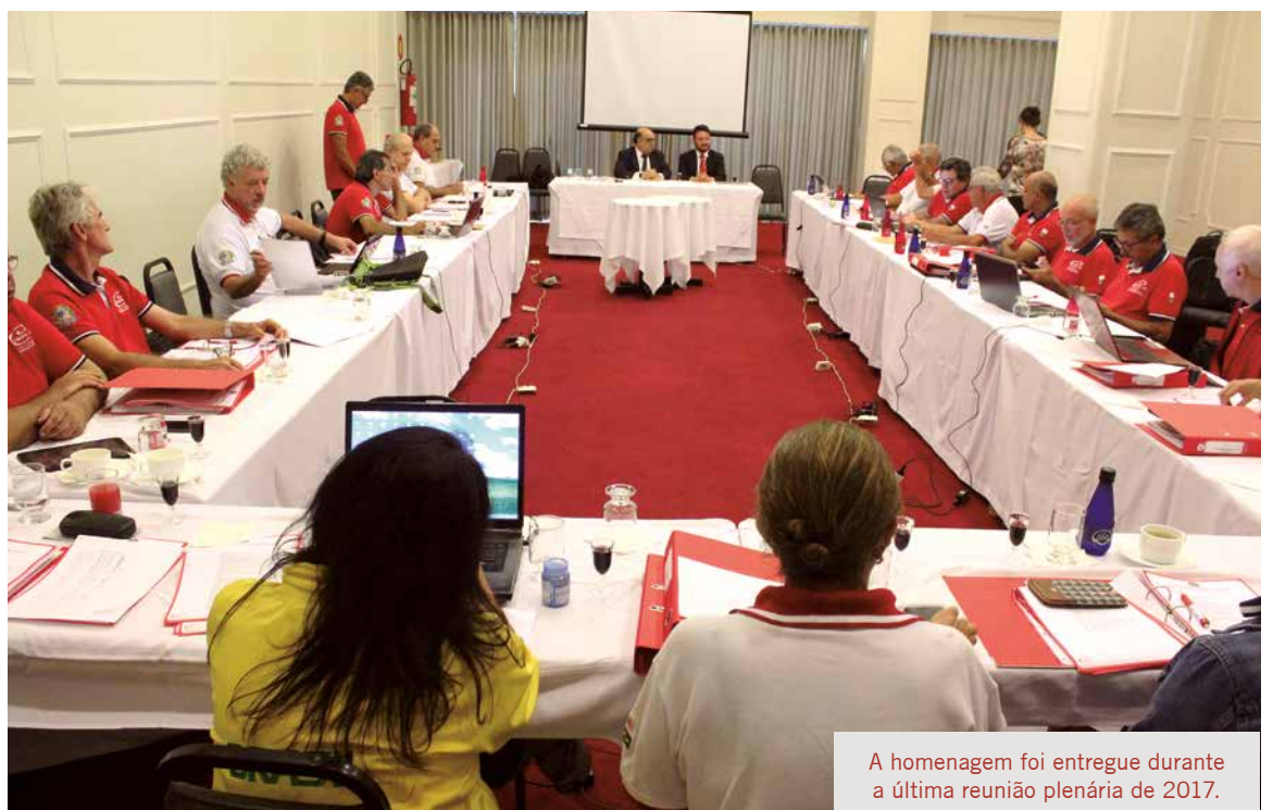
A homenagem foi entregue durante a última reunião plenária de 2017.

Para 2018, uma nova proposta já vem sendo avaliada e discutida entre os dois órgãos e também será dada continuidade aos projetos em andamento. “O CREF6/MG é uma fonte técnica muito valiosa a qual recorreremos sempre que necessário. Nos Seminários da Lei de Incentivo ao Esporte e em nossas Cartilhas, por exemplo, recorreremos ao CREF6/MG que dá mais robustez aos temas que propomos. Num cenário em que as pessoas estão mais atentas à qualidade de vida, parabenizamos a atuação dedicada do CREF6/MG ao lutar pelo exercício legal da Profissão de Educação Física. A população não pode ficar refém da prática irregular da profissão”.