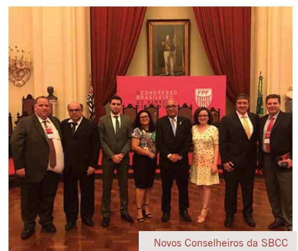
Novos Conselheiros da SBDD

O II Congresso Brasileiro de Direito Desportivo reuniu grandes nomes do Direito Desportivo do Brasil e do mundo. O principal objetivo foi promover uma evolução do pensamento crítico em torno da Lex Sportiva , Autonomia Desportiva, Cultura de Paz no Esporte, entre outros temas fundamentais ao desenvolvimento do Direito Desportivo.