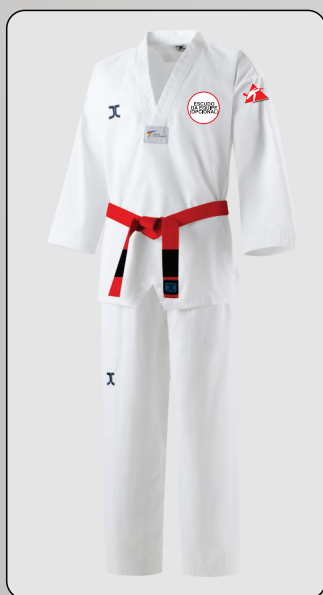
CANDIDATO 1º DAN / POOM

Além da utilização do modelo correto do Dobok, os participantes da Cerimônia de Graduação de Taekwondo deverão utilizar o patch da FTKDMG na manga esquerda do Dobok, que será disponibilizado.